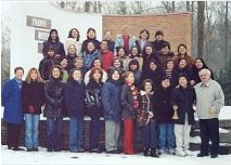
Cursillos No.1 de hombres y damas – Diócesis de London