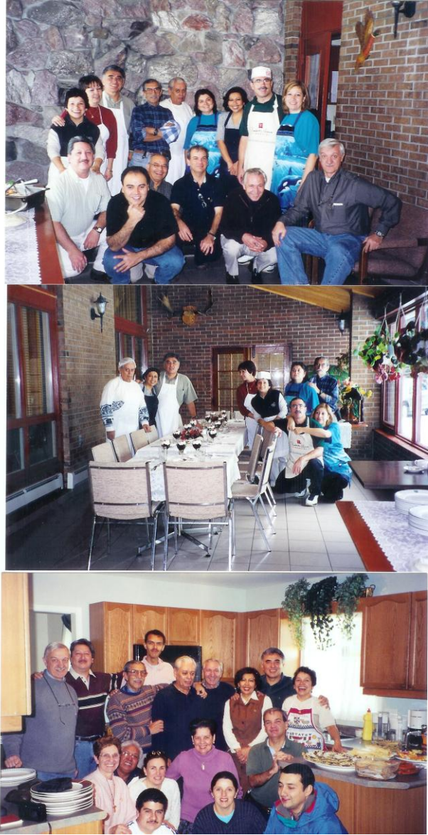
Reunión del equipo de dirigentes interno y externo – London, noviembre 2002